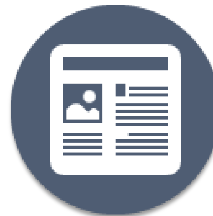
H2 auswerten (Aspekte)