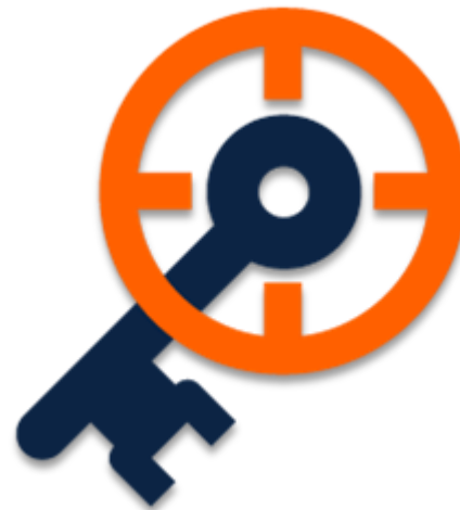
Bestimmung der Keywords-Cluster