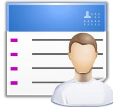
Entscheidung über Integration in Website-Struktur