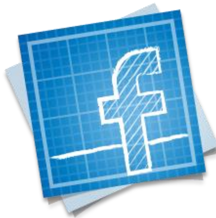
Social Media Marketing