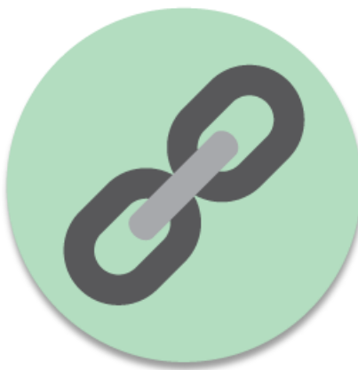
Vernetzung im WWW