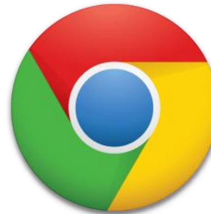
Erfolg in Suchmaschinen