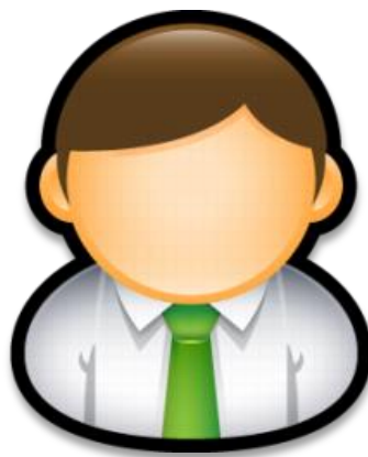
Mit Fokus auf Besucher