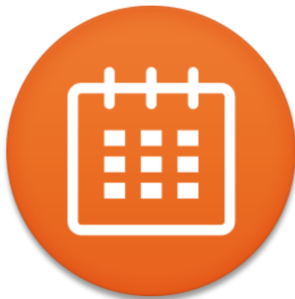
Alter der Website

2, Alter und Vernetzung im WWW = Popularität Ihres Unternehmens