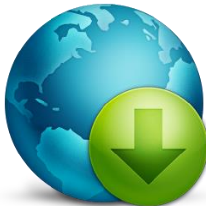
Verlinkung zu Top-Seiten