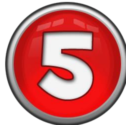
Die 5 W-Fragen