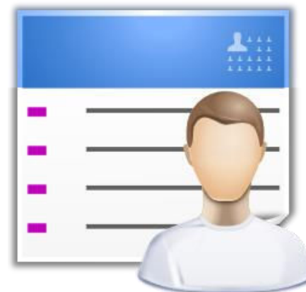
Entscheidung über Integration in Website-Struktur